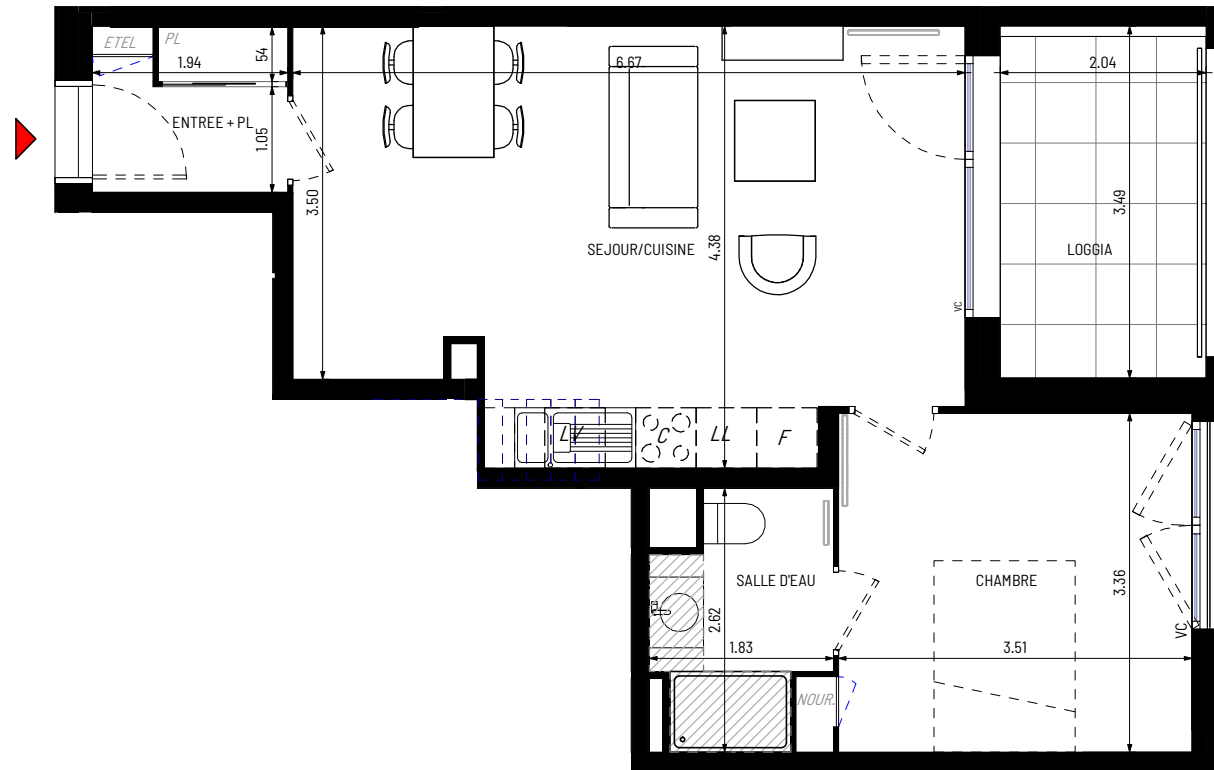
BAT B / Appartement n°44 / T2 / R+2