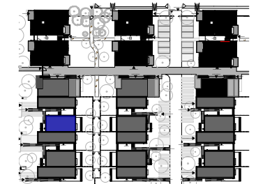
Plan de repérage